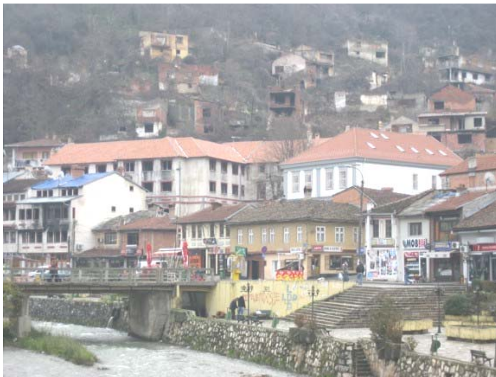
Поглед на зграде православне Богословије. С десне стране се види већ скоро завршени објекат Задужбине Симе Игуманова, а с леве стране су Деканат и Интернат који су покривени кровом како би се заштитили од даљег пропадања. Њихова обнова треба да почне у 2008.

Поред ових радова, КСО је предузео и радове на обнови кровне конструкције на објектима деканата и интерната . Ови објекти су велике површине али новијег порекла. Овом интервенцијом даље пропадање је смањено на минимум, што омогућава услове за будућу реконструкцију која је предвиђено да почне у току 2008. године.