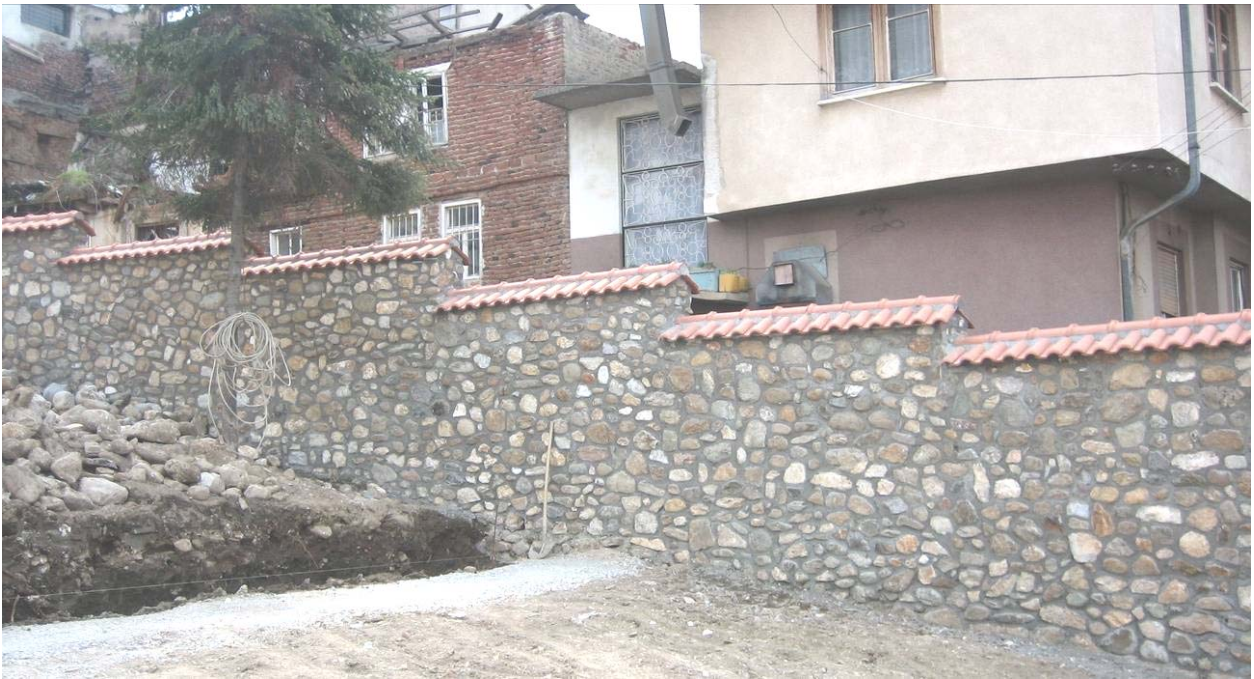
Нови камени оградни зид око комплекса Богословије