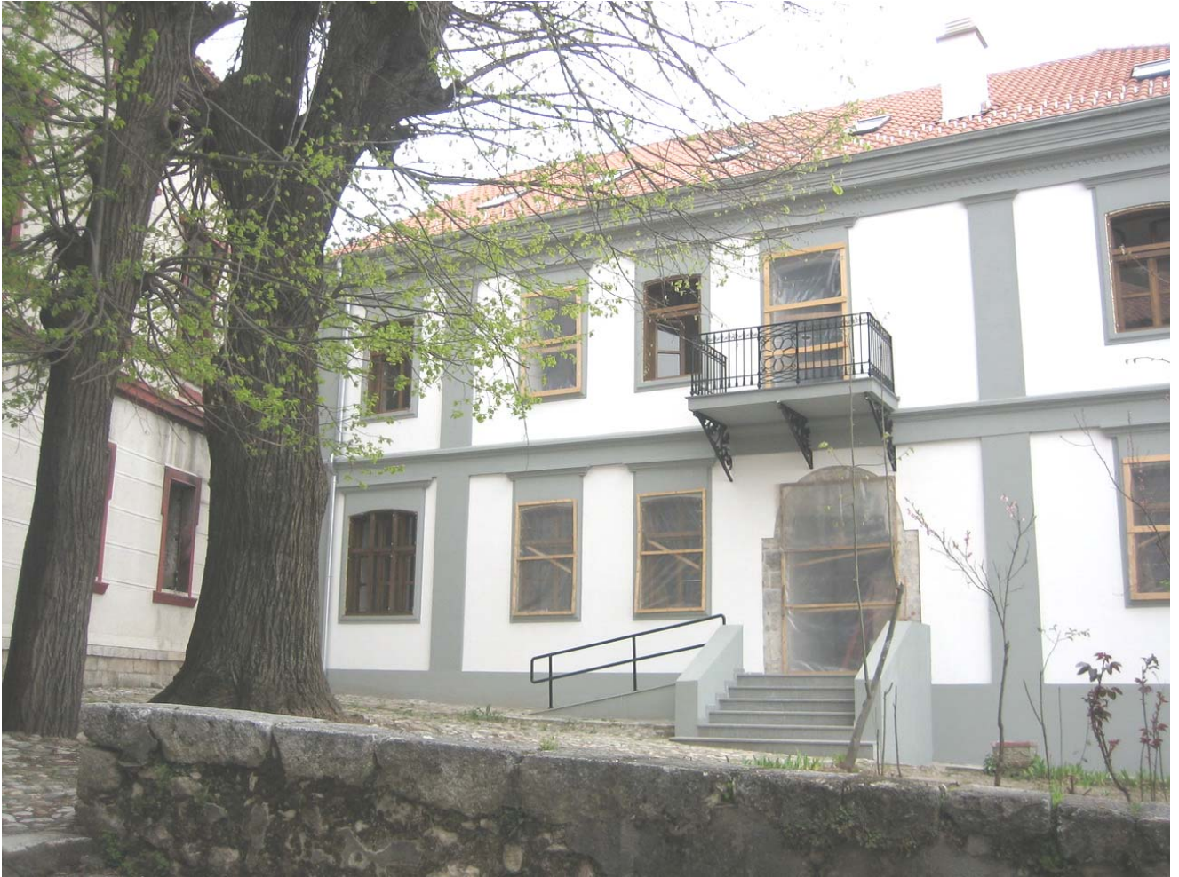
Изглед задужбине Симе Игуманова почетком априла 2008. године