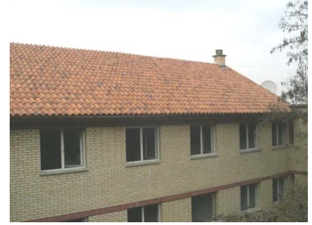
Покривање зграде интерната и деканата – јесен 2007.