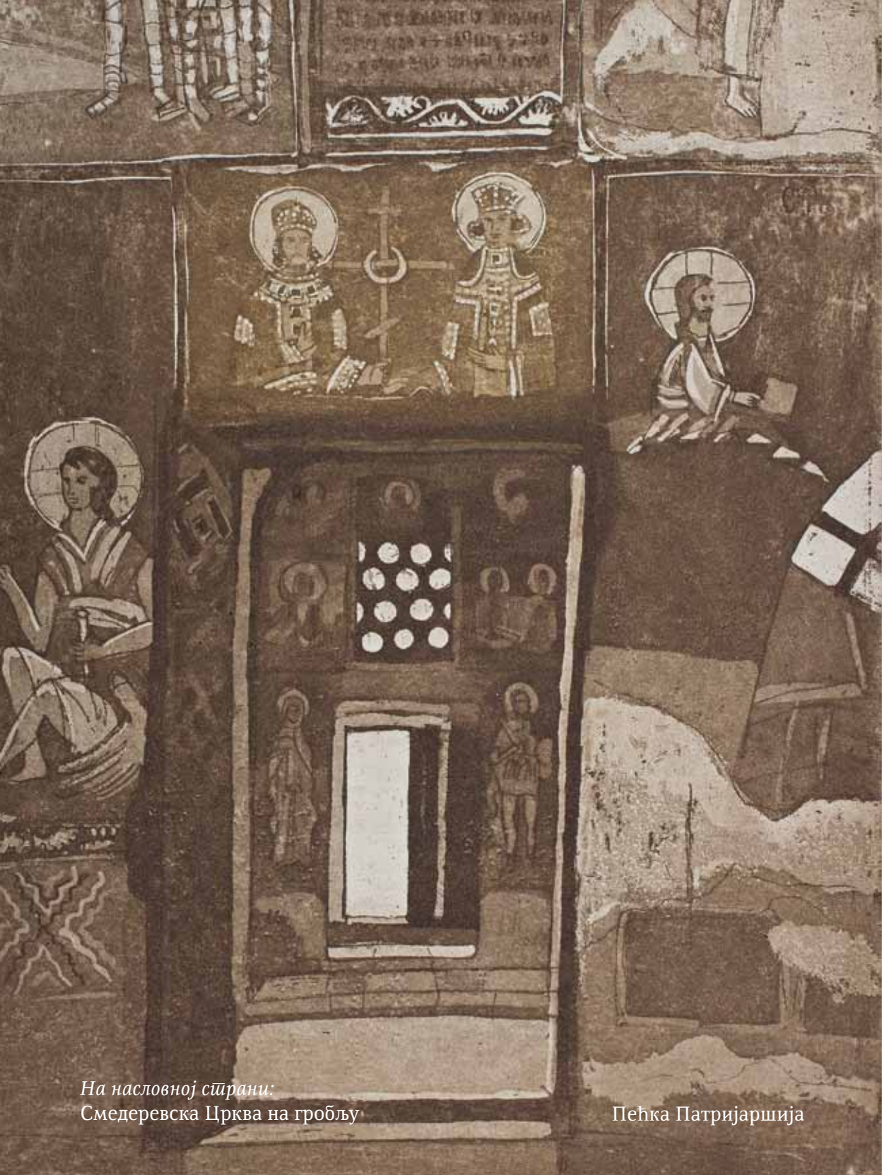
На насловној страни: Смедеревска Црква на гробљу