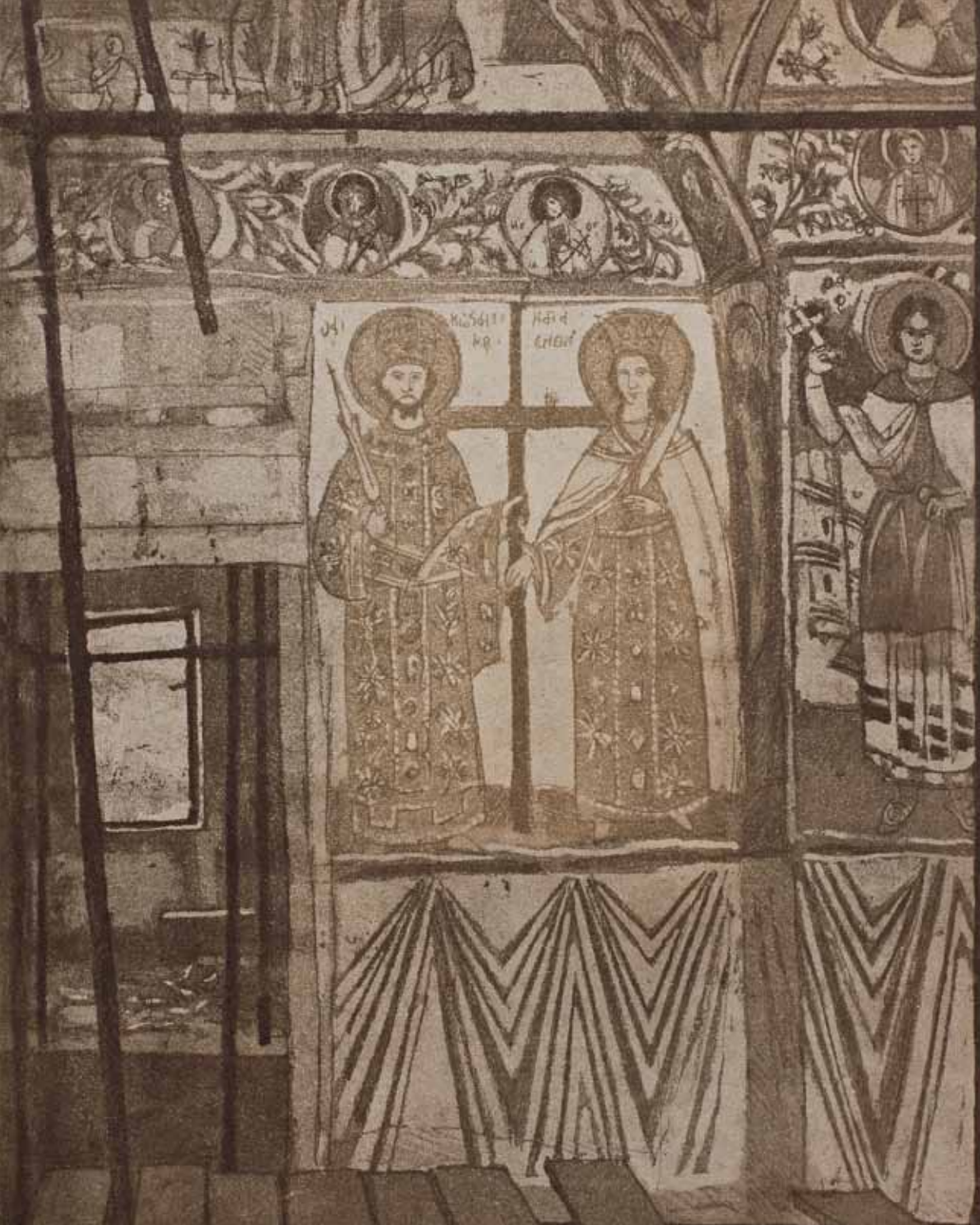
Хиландар – Параклис Светог Димитрија