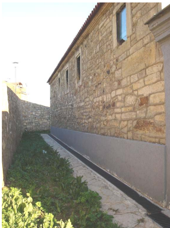
Поглед на звоник и крстионицу – десно: северни део храма према гробљу (дренажа)