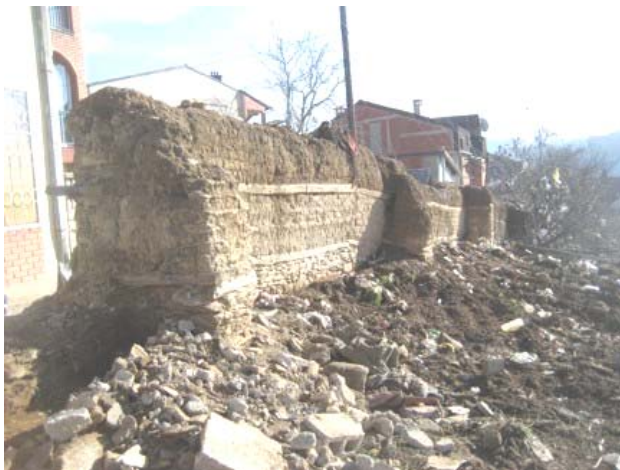
Део обрушеног оградног зида пре обнове