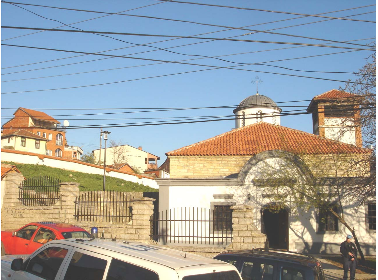
Храм св. Николе у Приштини са новом металном оградом и оградним зидом око порте и гробља (почетак априла 2008 год.)

Црква Св. Николе у Приштини је била озбиљно оштећена у пожару, марта 2004. Изгубила је кров и била је изложена даљем пропадању и пљачки све док није изграђен импровизовани заштитни кров 2005. године, са циљем да се максимално смање негативни ефекти временских утицаја. У 2006. предузети радови на обнови и на цркви су завршени, док су већим делом комплетирани радови и на парохијском дому, крстионици и звоннику.