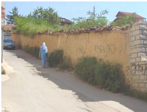
Изглед оградног зида пре обнове