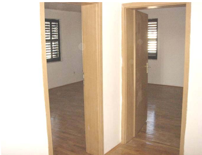
Унутрашњи изглед просторија у два стана у парохијском дому поред цркве