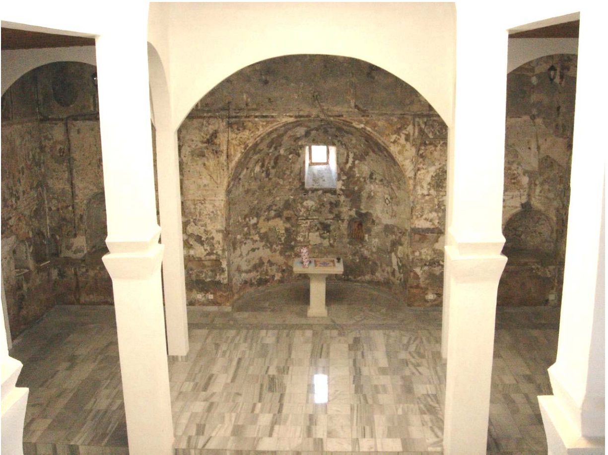
Поглед на олтарски део са галерије. Верни народ на часној трпези оставља дарове: приликом снимања ове фотографије нађени су хлебчићи, мали бадњаци, кадионица са тамјаном. На зидовима се виде остаци фрескописа чија је конзервација предвиђена у завршној фази радова.