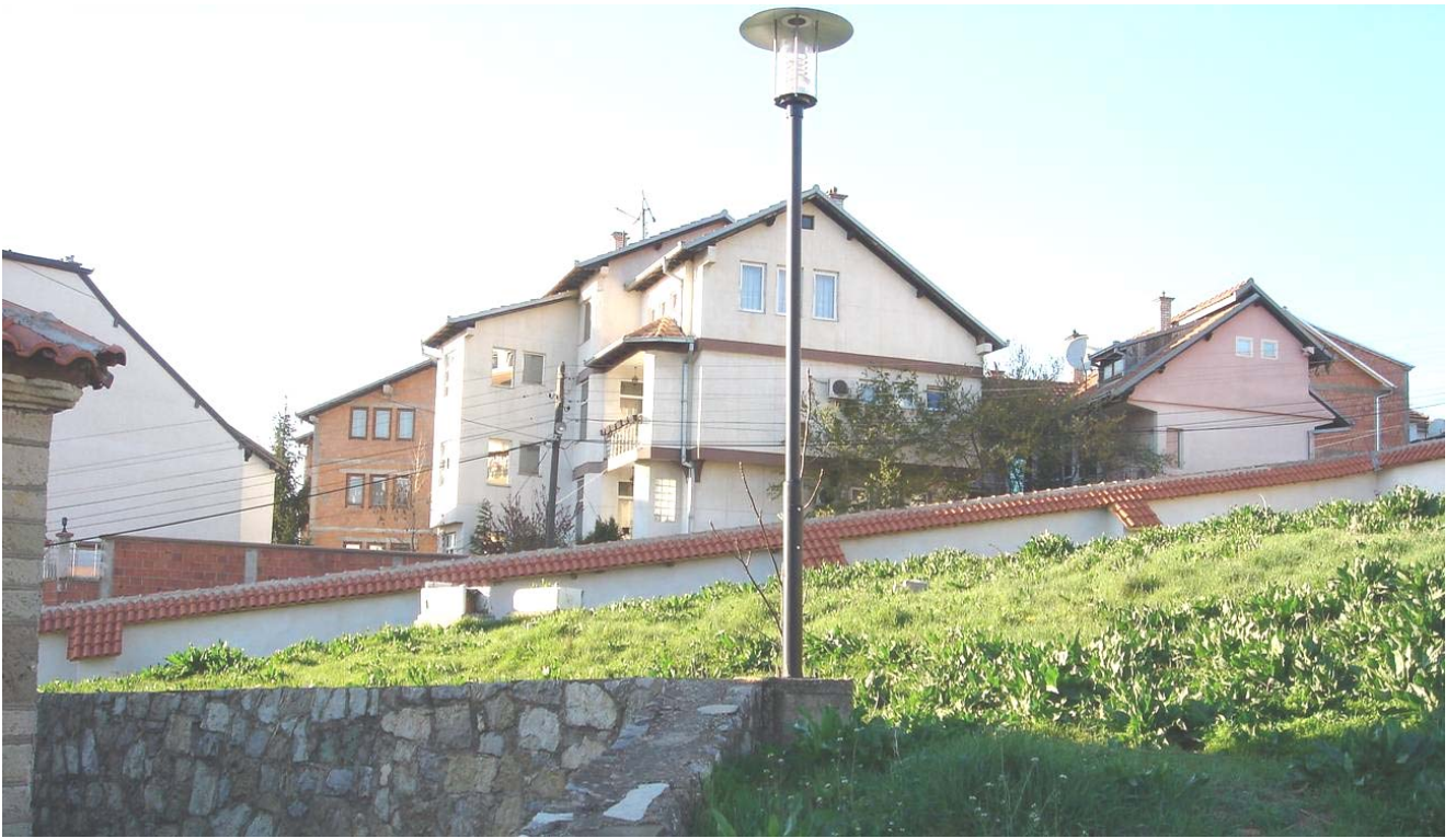
Поглед на сада ограђено двориште и нови зид који окружује старо приштинско гробље. У дворишту су постављене нове лампе за осветљење.