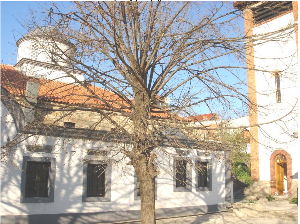
Поглед на јужни део храма са звоником, поч. априла 2008.