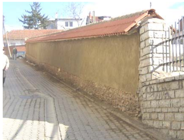
Изглед оградног зида у току обнове