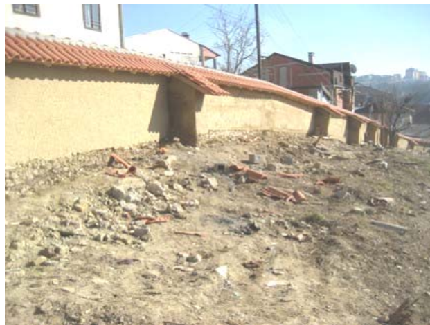
Нови оградни зид у завршној фази обнове