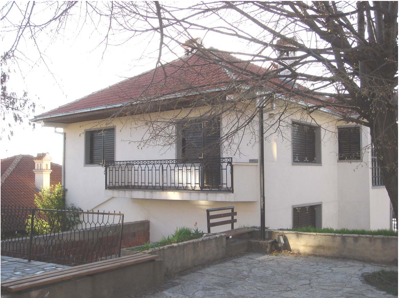
Завршени парохијски дом, почетак априла 2008. године.