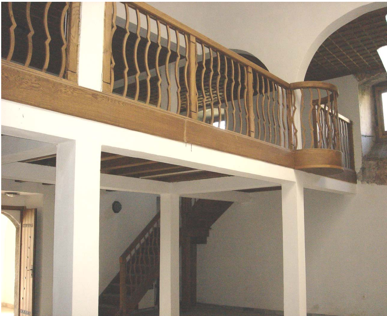
Унутрашњост храма Св. Николе – западна галерија, април 2008.

Уведен је нови дренажни систем око цркве са циљем да се ублажи продирање воде у објекат и смањи ниво влаге, која тренутно утиче на зидове и унутрашњост објекта. Почетком априла 2008. постављена је нова метална капија, а предвиђена је обнова чесме, постављање дрвених клупа, чишћење и обнова гробља и громобранска заштита. Завршни радови на парохијском дому, крстионици и звонику су такође при крају, а ти радови обухватају и постављање новог степеништа од храстовине у звонику. Постављање звона је предвиђено када се црква уведе у литургијску употребу.