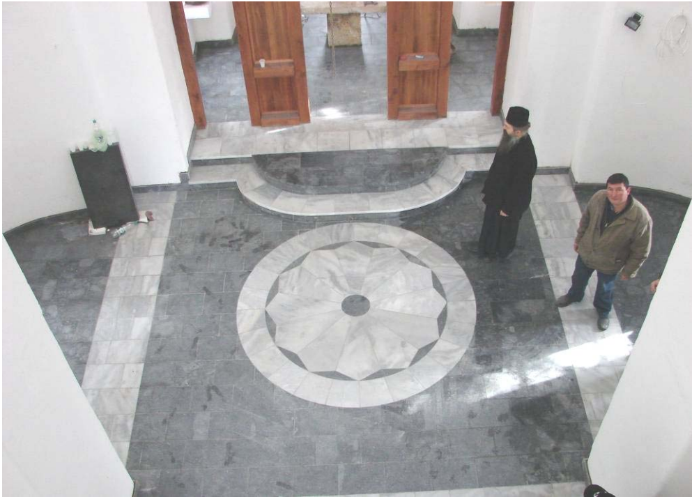
Нови мермерни под у обновљеном храму Св. Апостола Петра и Павла у Истоку, фебруар 2008.

Такође, неке критике да обнова која се врши у сарадњи са косовском страном под Комисијом Савета Европе наводно води ка губитку идентитета наших светиња, очигледно представљају замену теза. Управо држање светиња у рушевинама и нерад на њиховој обнови послужио би том губитку, а добро је познато да су услови за другачији начин обнове на већински албанским територијама Косова веома тешки, ако не и потпуно немогући. Стога се у обнови стално наглашава српски православни карактер светиња и у том процесу косовска страна осим новчане подршке тј. надокнаде почињене штете и логистичке помоћи у комуникацији са општинама, нема никакву стручну или било какву другу ингеренцију.