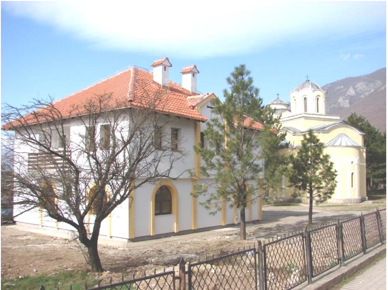
Храм Св. Апостола Петра и Павла са парохијским домом, Исток