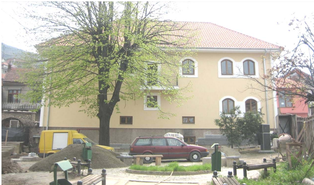
Северна фасада обновљеног Владичанског двора у Призрену, април 2008.