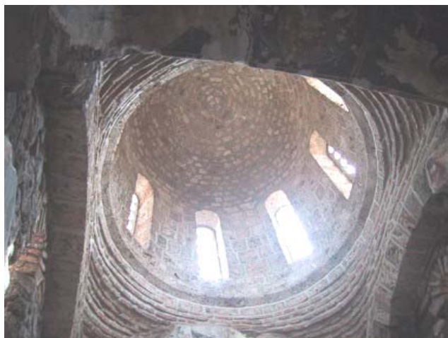
Почетно стање унутрашњости куполе