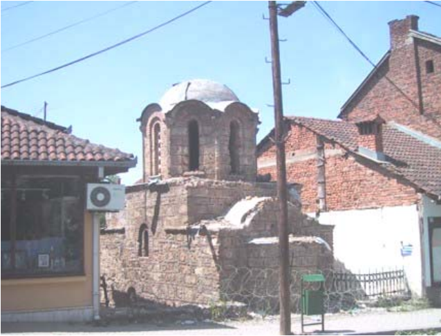
Црква у лето 2004 год.