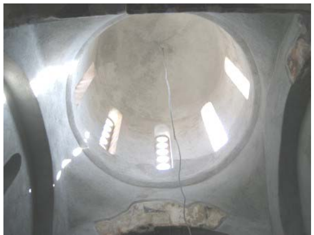
Купола након конзерваторских радова