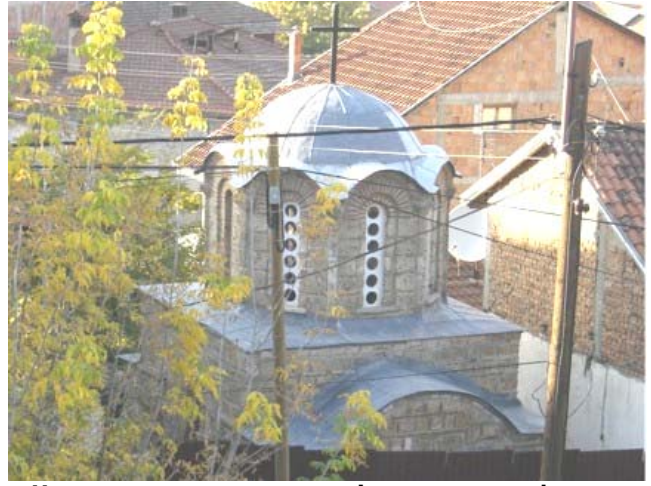
Црква после консолидације и поправке фасаде