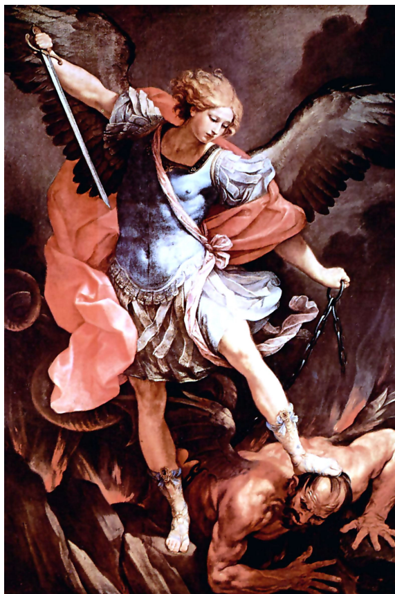
Гвидо Рени „Архангел Михаило побјеђује Сатану“

Хришћанство Архангела Михаила сматра заштитником Универзалне цркве и првим од седам архангела, као и побједника Луцифера и Сатане. Због тога се у умјетности увек представља у оклопу са подигнутим мачем или копљем како пријети демону или змају.