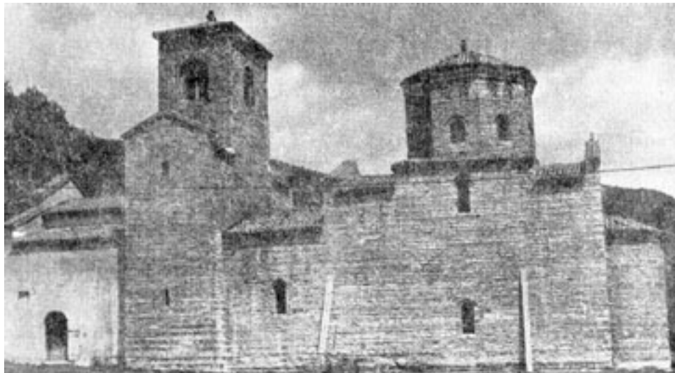
Манастир Ђурђеви Ступови код Берана